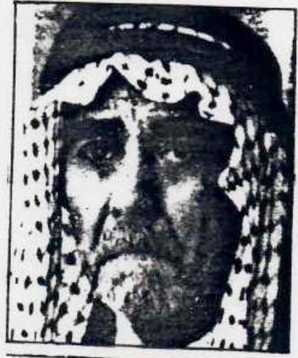
● شعر : معروف الرصافي ●